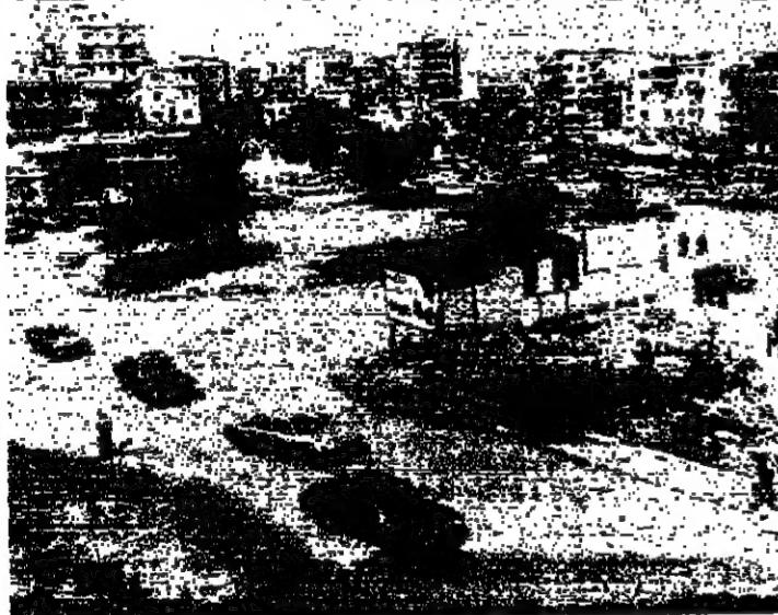
عجلة سيري في حين الشبك اس